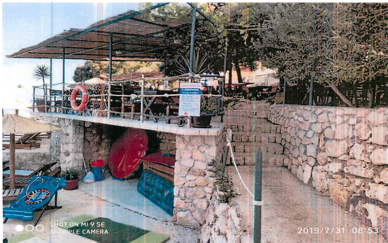
Sl.5. terasa ug.objekta "Vongola"

U Programu privr.lokacija za period 2019-2023.god na navedenom prostoru nije predviđena lokacija terase ugostiteljskog objekta. Po navodima korisnika Zahtjev za ucrtavanje lokacije terase predat Javnom preduzeću i Ministarstvu održivog razvoja i turizma.