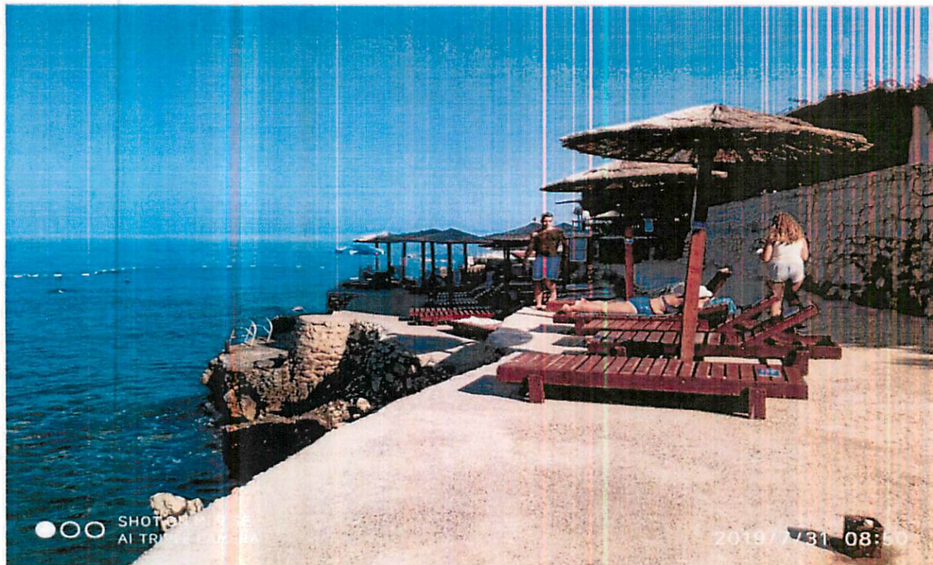
Slika 2 3 i 4 kupalište 13F

U neposrednom zaleđu kupališta 13E, organizovana terasa za obavljanje ugostiteljske djelatnosti restorana "Vongola", najvjerojatnije na kat.parceli 4249/1 KO Kunje (državna). Zbog specifičnosti kaskadnog ranije betoniranog terena , potrebno precizno izvršiti geodetsko razgraničenje parcela.