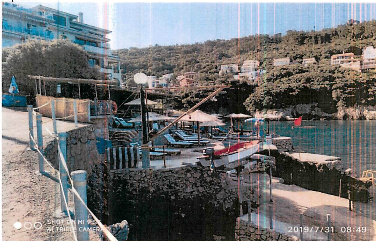
Sl.6 zapadna granica kupališta 13E

Na zapadnom kraju kupališta 13E, postavljena rampa za podizanje manjih čamaca, koja je van obuhvata kupališta.